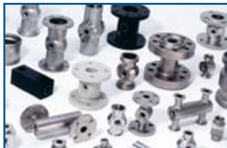
Células de medición para cualquier aplicación