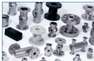
Corpos de medição para qualquer aplicação